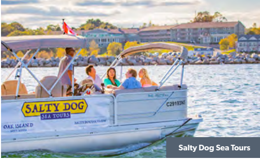
Salty Dog Sea Tours