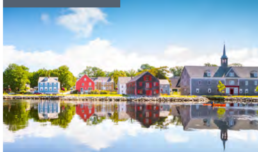
Front de mer de Shelburne

Des paysages terrestres à l'état naturel, des panoramas marins et, parsemés ici et là le long de la côte, des villages bien vivants.