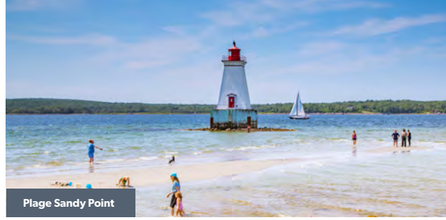
Plage Sandy Point