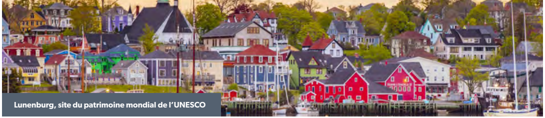
Lunenburg, site du patrimoine mondial de l'UNESCO

C'est dans cette région que se trouvent certains des attraits historiques les plus populaires et des paysages côtiers les plus renversants. Découvrez notre côte, notre culture et les nombreuses communautés dynamiques de South Shore.