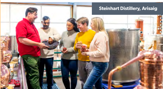
Steinhart Distillery, Arisaig

À New Glasgow, visitez Viola's Way pour découvrir la puissante histoire de Viola Desmond, qui s'est opposée à l'inégalité raciale et qui est devenue une figure de proue des droits civiques au Canada.