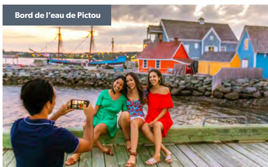
Bord de l'eau de Pictou

Northumberland Fisheries Museum, à Pictou Explorez une grande diversité d'artefacts de naufrages, un phare et une écloserie de homards en activité, unique en son genre, mettant en valeur un aquarium qui contient des homards de couleur rare.