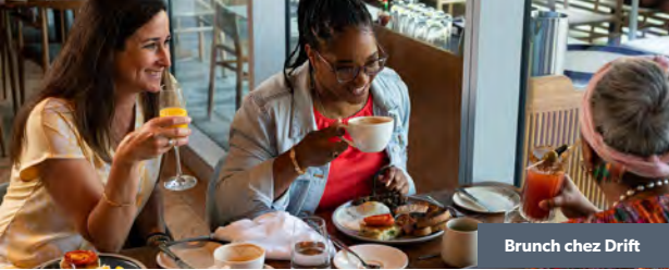
Brunch chez Drift

C'est à Halifax que vous trouverez vos mets favoris! Que vous soyez amateur de saveurs internationales ou de cuisine traditionnelle locale, que vos papilles gustatives soient aventureuses, timides ou curieuses, Halifax saura vous plaire.