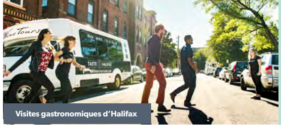
Visites gastronomiques d'Halifax