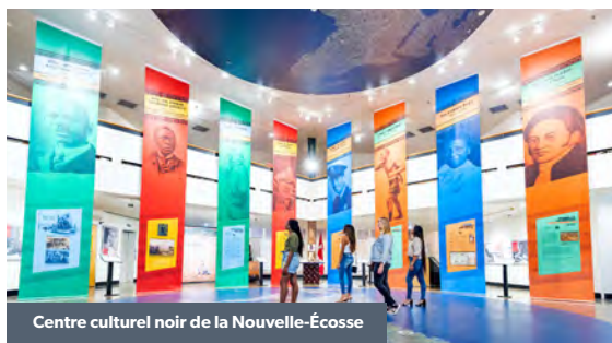
Centre culturel noir de la Nouvelle-Écosse

Le musée est une réplique de l'église qui était au cœur d'Africville. Vous y trouverez des présentations audiovisuelles, des photos, des panneaux descriptifs et des artefacts illustrant l'histoire d'Africville, communauté africaine en Nouvelle-Écosse détruite dans les années 1960. Promenez-vous dans le parc d'Africville et laissez-vous guider par les panneaux d'interprétation qui retracent l'histoire, les familles et la vie quotidienne des anciens résidents d'Africville.