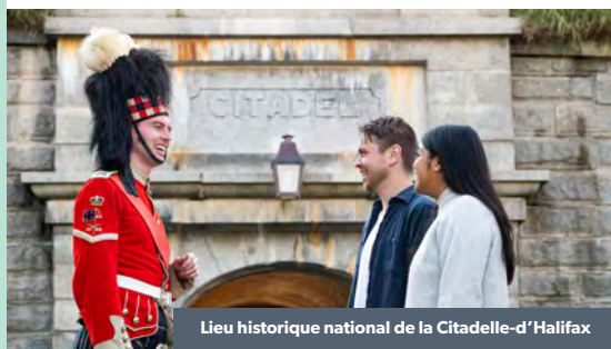
Lieu historique national de la Citadelle-d'Halifax

Les amateurs d'histoire seront ravis de plonger dans le fascinant patrimoine culturel, maritime et militaire d'une ville fondée en 1749.