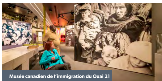
Musée canadien de l'immigration du Quai 21