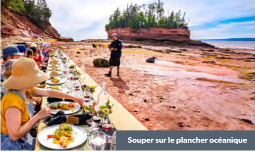
Souper sur le plancher océanique