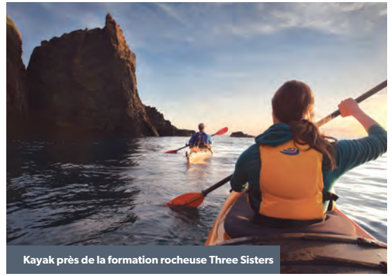
Kayak près de la formation rocheuse Three Sisters

Cette visite guidée de trois heures vous fait parcourir 4 kilomètres dans l'un des trois canyons en fente de la province. Vous serez émerveillé par les parois de canyon de 200 pieds de haut! Faites l'expérience de cette randonnée dans une forêt ancienne, le long de chutes d'eau, sur un lit forestier verdoyant et moussu, à tout moment de l'année. Raquettes à neige disponibles en hiver.