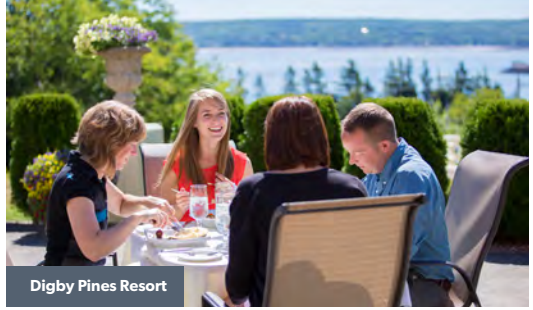
Digby Pines Resort