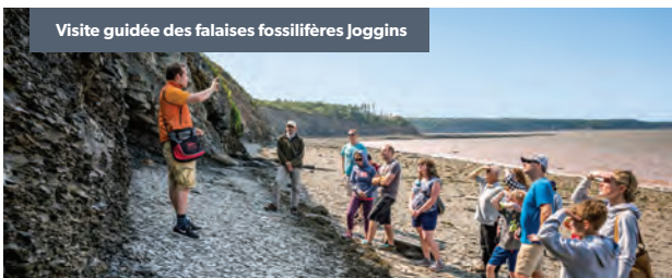
Visite guidée des falaises fossilifères Joggins

Autrefois nommé Jardin de l'année du Canada, ce magnifique site de 17 acres situé dans un cadre paisible, surplombe une vallée fluviale à marées et abrite la plus grande variété de roses de l'Est du Canada. Les visiteurs pourront également y admirer la reconstitution d'une maison acadienne de 1671.