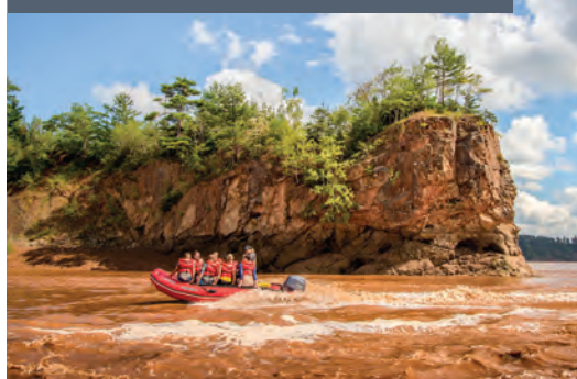
Canot pneumatique sur le mascaret, rivière Shubenacadie