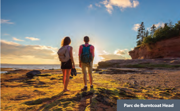
Parc de Burntcoat Head